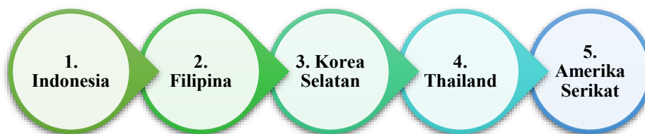
Gambar 1. 5 Negara dengan Fandom K-Pop Terbanyak

Tidak hanya itu, perkembangan teknologi juga memberikan dampak yang signifikan pada budaya populer global. Salah satu fenomena yang tengah trend beberapa tahun terakhir yaitu maraknya Korean Wave atau Hallyu . Kepopuleran Korean Wave tengah marak di Indonesia, terutama kalangan generasi muda. Perilaku fanatik yang potensial berakibat pada pemikiran-pemikiran generasi bangsa yang mudah terpengaruhi (Valenciana & Pudjibudojo, 2022), hal ini menyebabkan ketertarikan yang berlebihan sampai tingkat kegilaan sekalipun.